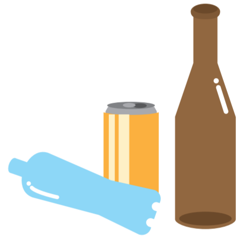
屋外に放置された空きビン・缶・ペットボトル