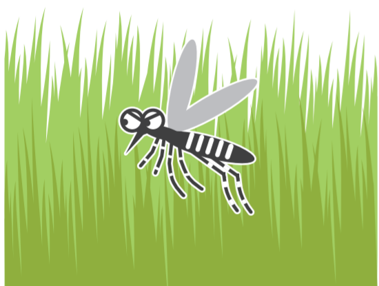
風通しの悪いやぶ・草むら

公園、学校、寺社、空海港、駅などの施設を管理されている方もご協力をお願いします!